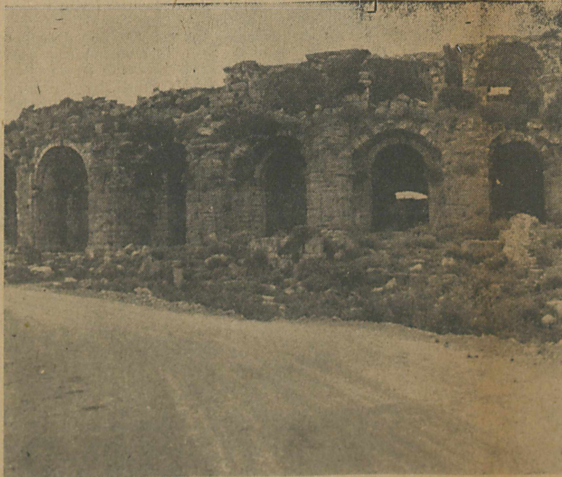
Side Tiyatrosu'nun anayol üzerindeki «anfiteatrum»-unun dayandığı kemerler. Bu tarihî eseri eski haliyle görmek ve orada gömü seyirci kitlelerine temsil göstermek mümkün olacaktır.

İlgililerin «Yeniden doğuş» olarak bahsettikleri Side'de Tiyatro'nun son alacağı şekil üzerinde çalışmalar yapan Arkeolog - Mimar Mübin Beken, hazırladığı projeler hakkında bilgi vermiş, restorasyon için lüzumlu mermerlerin Marmara adasından getirildiğini söylemiştir. Mübin Beken Turizm Tanıtma Bakanlığı ile UNESCO'nun müşterek organizasyonunda «Eski Eserleri Onarma» Derneği Başkanı İtalyan Profesörü Sanpaolesi ile beraber çalıştıklarını da ifade ederek, «Yıllar sonra eski havasımı andırarak Side Tiyatrosunda, Romalılar devrinde olduğu gibi muhtelif gösteriler yapılacak, uluslararası şenlikler tertiplenecek, binlerce kişinin buraya akın etmesiyle esasen şöhrete ulaşmış olan bu belde, bir kat daha güzelleşip, kalkınabilecektir.» demiştir.