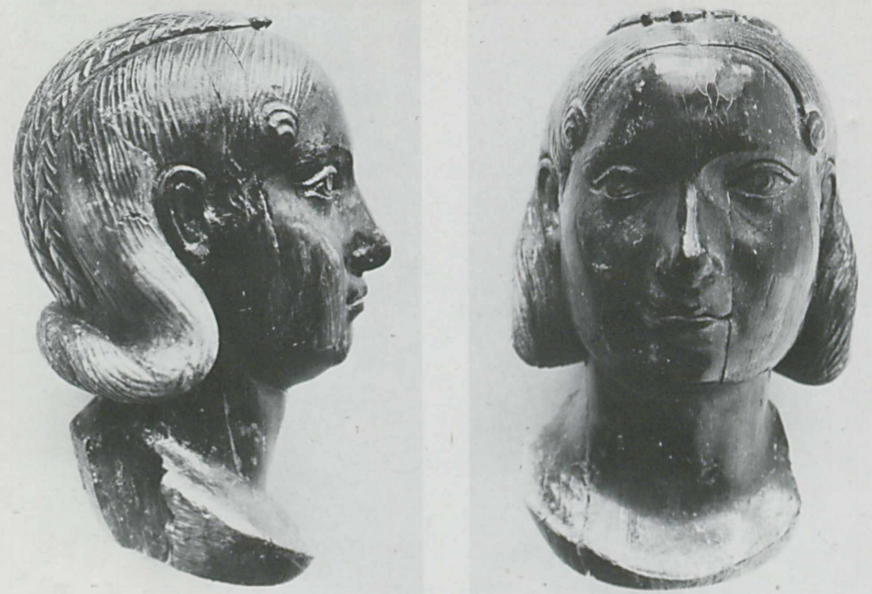
Nr. 160. Ephesos. Selçuk, Museum. 250-60. Elfenbein