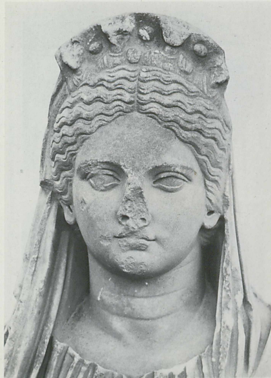
1.2. Nr. 225. Plancia Magna. Perge. Antalya, Museum. Hadrianisch