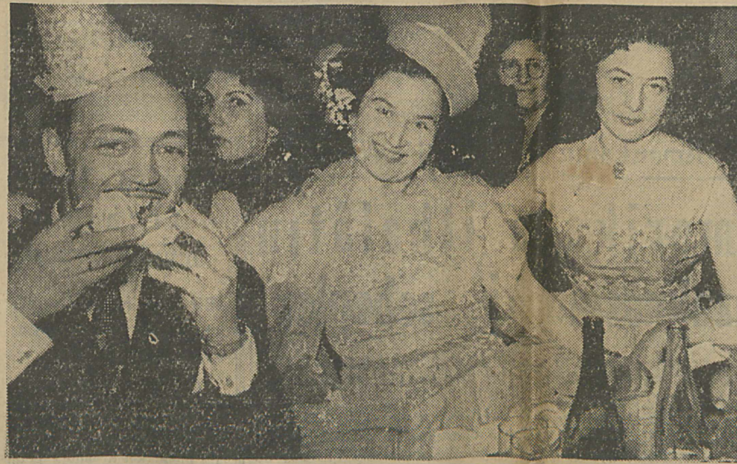
Ankara'da yeni yıla neşe içinde giren bir grup.