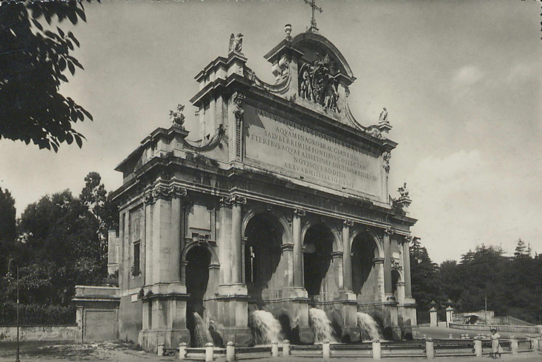
Roma - Fontana dell'acqua Paola in S. Pietro in Montorio