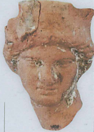
Tekirdağ'da Heraion Teikhos tümülüsünde yapılan kazılarda, Helenistik döneme tarihlenen Tyhe figürinine ait bir baş çıkartıldı. Tyhe figürünü gibi mezarlara bırakılan hediyeleri Trakların ölü gömme gelenekleri hakkında bilgilere ulaşıldı.

yazı: NEŞE ATIK*