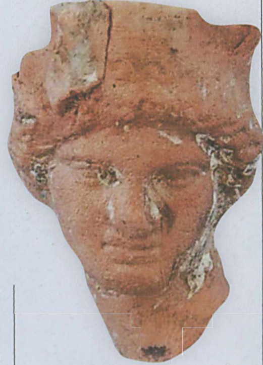
Tekirdağ'da Heraion Teikhos tümülüsünde yapılan kazılarda, Helenistik döneme tarihlenen Tyhe figürinine ait bir baş çıkartıldı. Tyhe figürini gibi mezarlara bırakılan hediyelerle Trakların ölü gömme gelenekleri hakkında bilgilere ulaşıldı.

Mezarda bulunan hediyeler; yalın pişmiş toprak kaplar, Helenistik döneme tarihlenen Tyhe figürinine ait bir baş ve Büyük İskender sikkesi. Yalın kapların, dönemin pahalı metal kaplarını taklit eden siyah parlak astarlı kaplara benzer şekilde biçimlendirilmesine karşın çok aceleyle ve kabaca şekillendirildiği görülüyor. Alt kısımları düzgün olmadığından dik duramayan, kötü pişirilmiş bu kapların mezar hedyesi olarak yapıldığı anlaşılıyor. Diğer iki tümülüs mezarda da ölü hedyesi olarak aynı yalın kaplardan çok sayıda bulunması Heraion Teikhos tü-